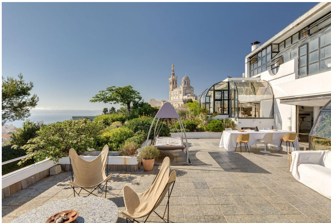
La terrasse avec vue panoramique sur Marseille.