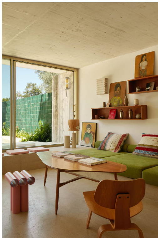
Le salon ouvert sur l'extérieur pour prôner le vivre-dehors.