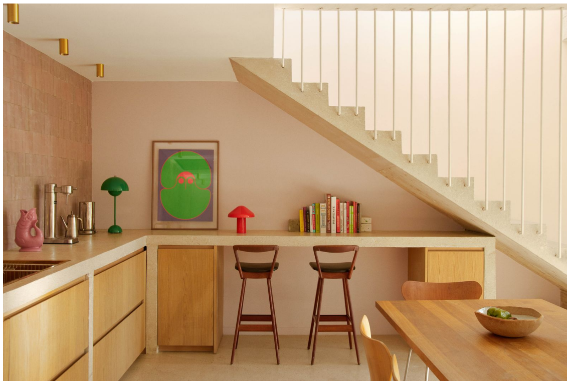
Vue de la salle à manger et de l'escalier desservant le premier étage.