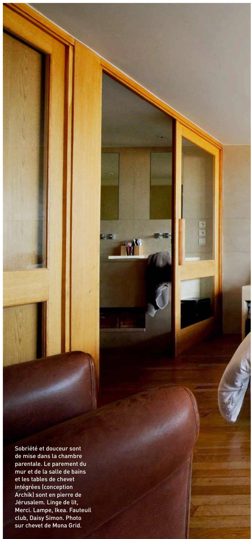
Sobriété et douceur sont de mise dans la chambre parentale. Le parement du mur et de la salle de bains et les tables de chevet intégrées (conception Archik) sont en pierre de Jérusalem. Linge de lit, Merci. Lampe, Ikea. Fauteuil club, Daisy Simon. Photo sur chevet de Mona Grid.

... le séjour orienté est, baignés d'une belle lumière grâce à l'immense verrière courant sur deux niveaux. Le long du mur, l'escalier métallique signé Jean Prouvé mène au niveau supérieur où sont situés les deux chambres et leurs salles de bains, ainsi que le grand salon familial ouvrant sur l'étroite loggia tout en longueur offrant un panorama sublime sur la Méditerranée. Le plancher blond au sol, les nombreux rangements aux portes de bois (prévus pour éviter le besoin de mobilier), la niche décorative dans le mur du salon, les baies vitrées à battants, les touches de couleurs primaires sur la terrasse, sont autant d'éléments qui donnent tout son charme à cet appartement. Amateurs de beaux objets et de mobilier design, les heureux propriétaires ont décoré leur nid dans un style contemporain en adéquation complète avec l'esprit des lieux. Matières, code couleur, style, rien ne vient dénaturer l'appartement d'origine. ■