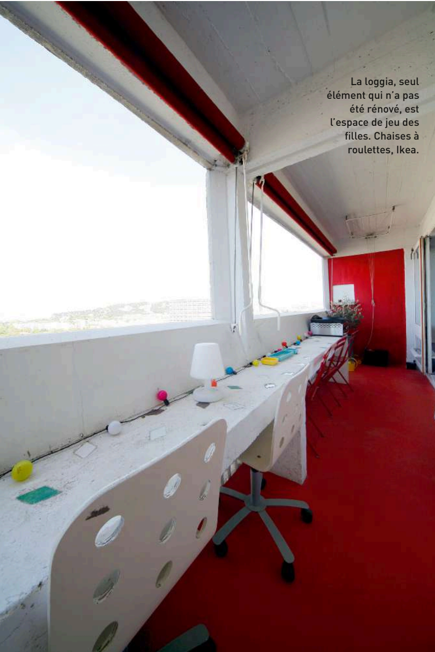
La loggia, seul élément qui n'a pas été rénové, est l'espace de jeu des filles. Chaises à roulettes, Ikea.

... le séjour orienté est, baignés d'une belle lumière grâce à l'immense verrière courant sur deux niveaux. Le long du mur, l'escalier métallique signé Jean Prouvé mène au niveau supérieur où sont situés les deux chambres et leurs salles de bains, ainsi que le grand salon familial ouvrant sur l'étroite loggia tout en longueur offrant un panorama sublime sur la Méditerranée. Le plancher blond au sol, les nombreux rangements aux portes de bois (prévus pour éviter le besoin de mobilier), la niche décorative dans le mur du salon, les baies vitrées à battants, les touches de couleurs primaires sur la terrasse, sont autant d'éléments qui donnent tout son charme à cet appartement. Amateurs de beaux objets et de mobilier design, les heureux propriétaires ont décoré leur nid dans un style contemporain en adéquation complète avec l'esprit des lieux. Matières, code couleur, style, rien ne vient dénaturer l'appartement d'origine. ■